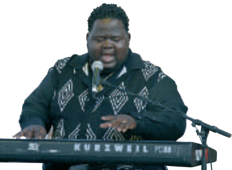
Figure emblématique des églises noires de la Nouvelle Orléans, parent de Fats Domino, Craig Adams, chanteur à la voix d'or et talentueux pianiste et organiste, orchestre ses claviers, ses musiciens et ses chanteurs, dans une déferlante rythmique et vocale tout en blues et gospel.